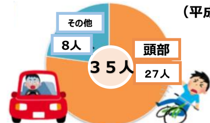
自転車乗車中の死亡事故における負傷部位（平成29年）

自転車乗車中の交通事故死者数を負傷部位別にみると、頭部が最も多く27人で、約8割を占めています。