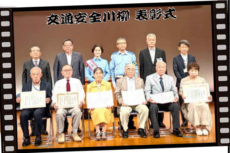
たくさんのご応募ありがとうございました！