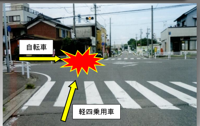
8月16日(日)午前9時20分頃、江南市高屋町地内で、80歳代の女性が乗る自転車と軽四乗用車が衝突。