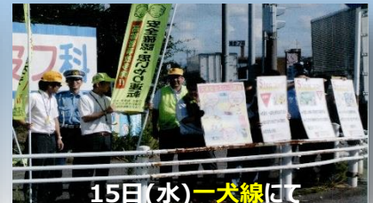
15日(水)一犬線にて 県内一斉街頭大監視活動