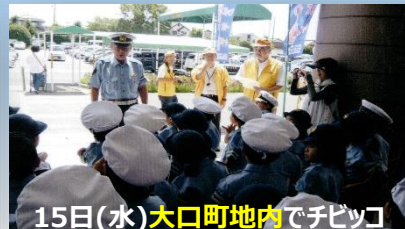
15日(水)大口町地内でチビッコ 警官による飲酒運転根絶キャンペーン