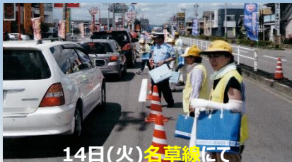
14日(火)名草線にて 3S運動周知キャンペーン